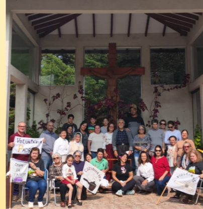
ENCONTRO SETEMBRO 2024