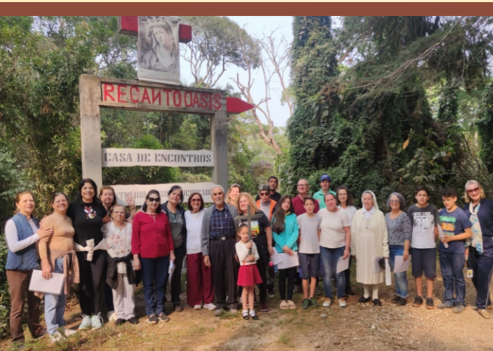
ENCONTRO SETEMBRO 2024

É missão do Espírito Santo nos tornar - pela morte e ressurreição de Jesus -, membros vivos de Cristo e, assim, verdadeiros filhos de Deus, fazendo-nos nascer espiritualmente (no Pensamento e na Vontade) “da água e do Espírito Santo” no sacramento do Batismo (Jo 3,5).