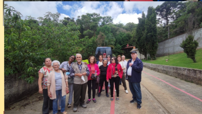
ENCONTRO NOVEMBRO 2024