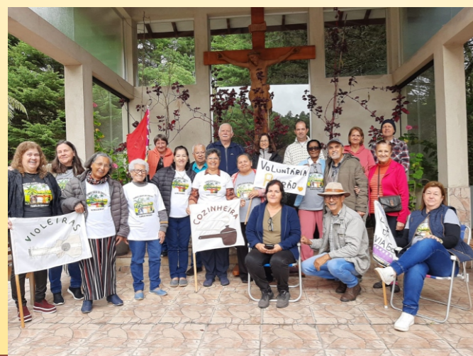
ENCONTRO NOVEMBRO 2024